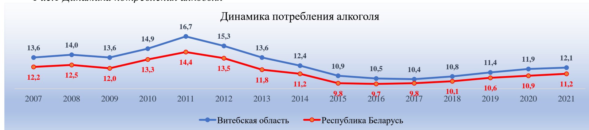
Рис.1 Динамика потребления алкоголя

Уровень потребления в Витебской области на протяжении периода наблюдений (2007-2021 годы) превышает среднереспубликанский уровень. Многолетняя динамика потребления алкоголя за период наблюдения 2007-2021 годы следующая: период 2007- 2011 годы характеризуется тенденцией к умеренному росту со средним темпом (+4,9%), период